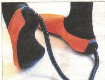
Schuh-Maus Zeichnen auf dem Computer mit den Füßen: die «Joyslippers».

Schnauzbärtige Heimwerker, die sich an ihrer Schlagbohrmaschine erfreuen? Nein. Stattdessen ein kreativer Robotik-Experte, ein Hardware-Hacker oder ein Elektromusik-Pionier, die zum Mitmachen, Staunen oder gebannten Zuhören einladen. 15 Künstler aus dem In- und Ausland bieten am Festival einen bunten Mix aus elektronischen und mechanischen Klangobjekten, Mitmach-Installationen, Workshops und skurriler Robotik. Und